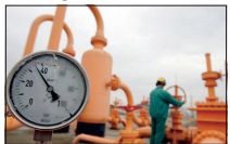
Odluka važi samo za privredna društva