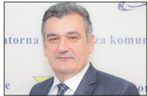
Kovač: Urediti oblast